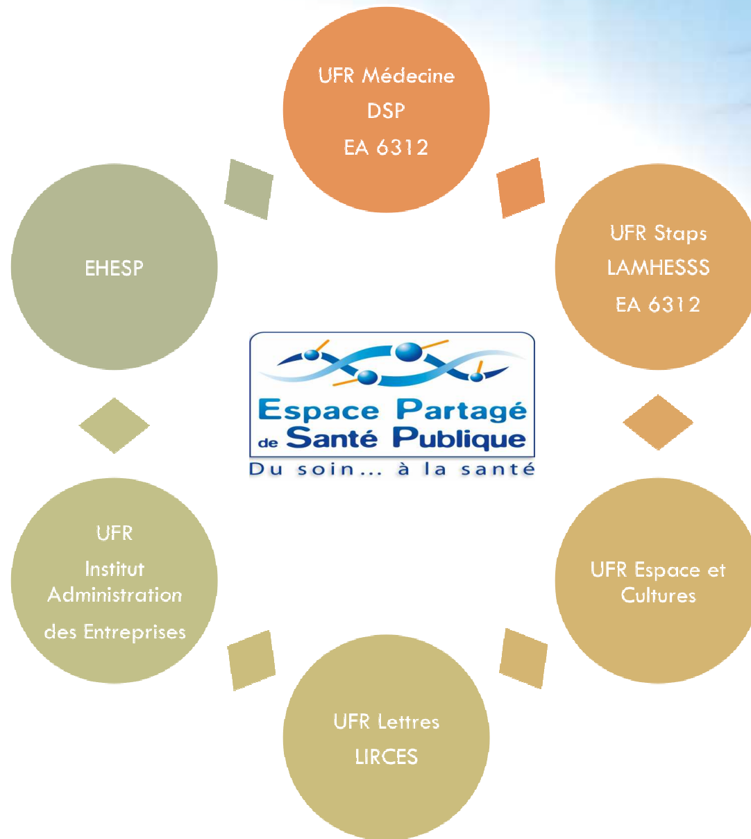
L'Espace Partagé de Santé Publique et son réseaux de chercheurs