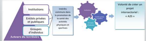
Figure 4: Illustration simplifiée du processus de création d'un projet intersectoriel et communautaire dans le domaine du sport-santé.